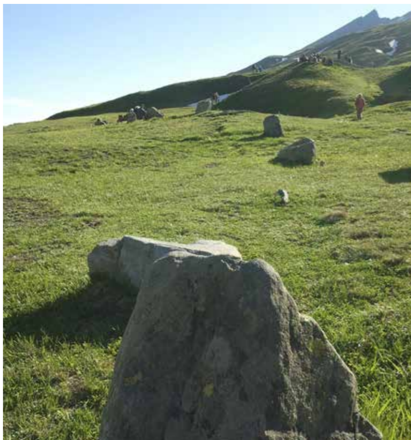
Menhir del Cromlech, Colle del Piccolo San Bernardo

Il 21 giugno, infatti, il Cromlech offre un emozionante spettacolo astronomico poiché il sole che tramonta dietro la sella del Lancebranlette (monte al di sopra del Cromlech), crea per circa mezzo minuto un'ombra a semicerchio che avvolge la struttura megalitica, lasciando solo l'area sacra in luce.