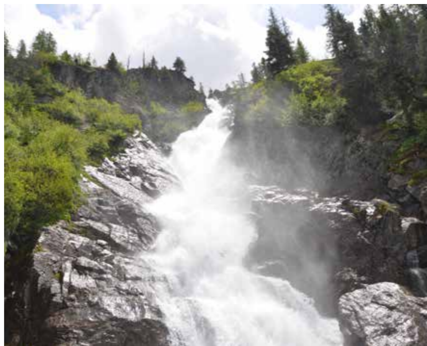
Cascade del Rutor

Partendo dalla frazione di La Joux a 1.603 metri di altitudine e posta a soli tre chilometri dal paese di La Thuile si può arrivare con un bel sentiero fino alla terza cascata che si trova invece a 1.996 metri. Il primo punto di osservazione si incontra dopo una ventina minuti di cammino dai casolari di La Joux, lungo una mulattiera che passa per boschi di conifere. La prima cascata è sorprendente, l'emozione dell'arcobaleno, la forza dell'acqua suscitano sensazioni incredibili.