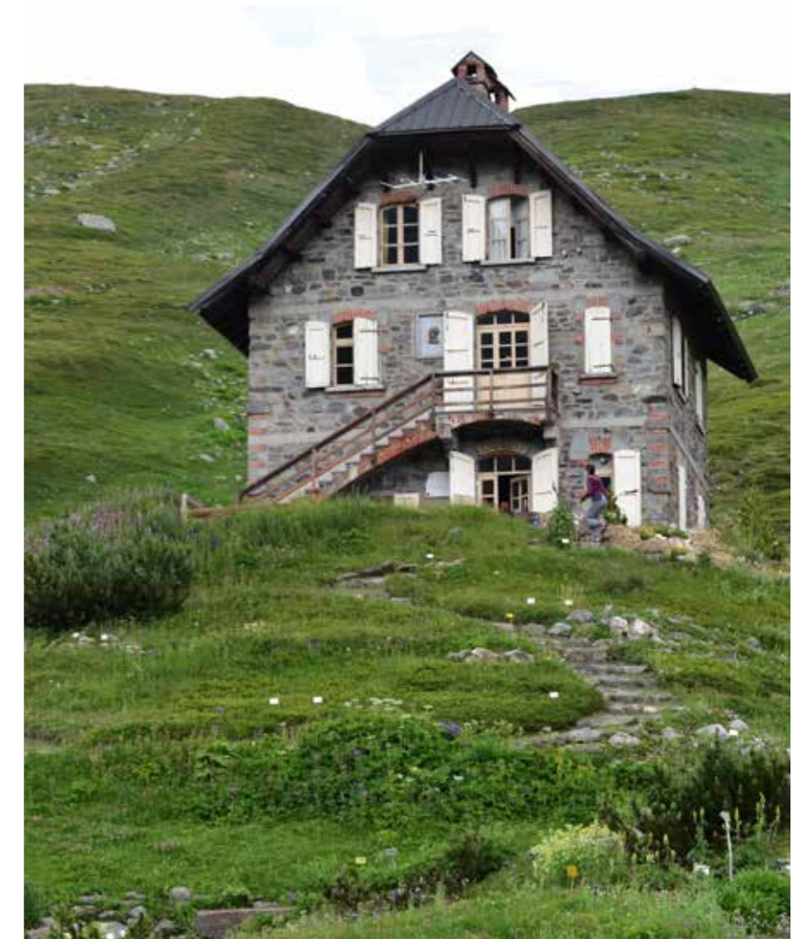
Giardino Botanico Chanousia

In questa zona di immensi prati verdeggianti, già in territorio francese, l'abate Pierre Chanoux, sacerdote con la passione per l'alpinismo, diede vita nel 1897 al Giardino Botanico Chanousia con l'obiettivo di far conoscere la bellezza e la rarità della flora alpina. Questo giardino botanico, il più alto d'Europa , visitabile da luglio a settembre, ospita più di 1000 piante alpine. Nei percorsi tra i fiori ognuno può provare un'esperienza sensoriale unica.