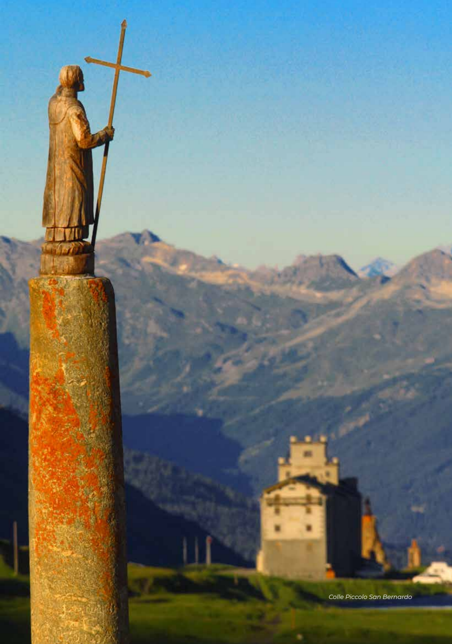
Colle Piccolo San Bernardo